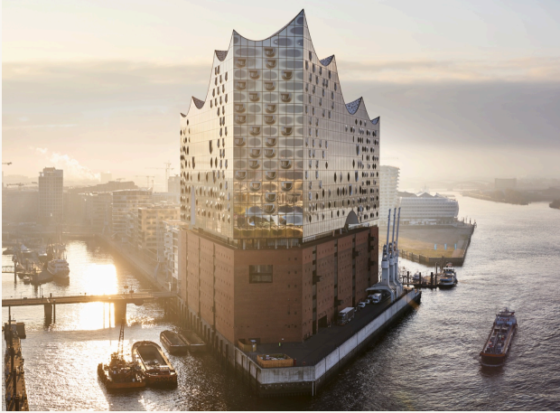
Elbphilharmonie SPEICHERSTADT · 2017