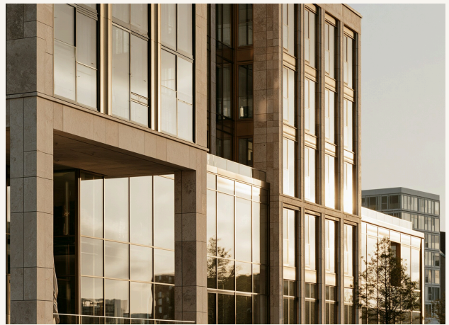
FIFTYNINE HAFENCITY · 2024