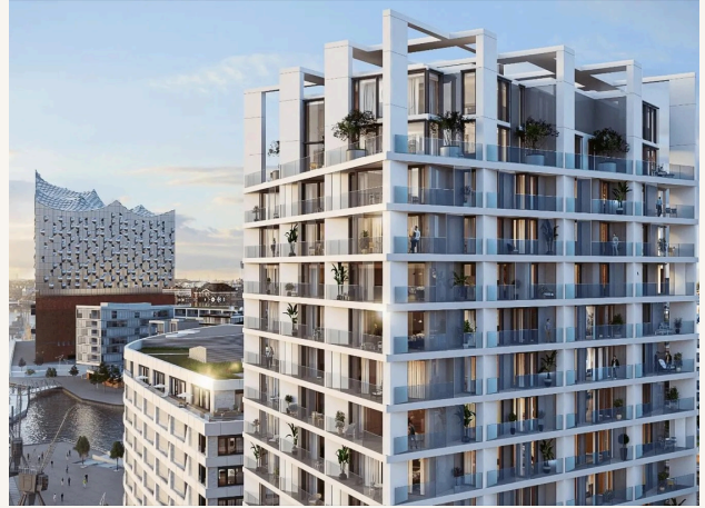
The Crown HAFENCITY · 2020