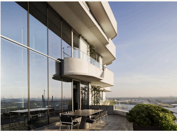
Marco-Polo-Tower HAFENCITY · 2010